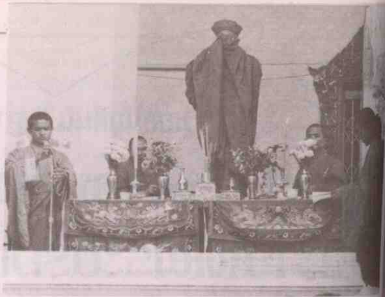
พระสงฆ์ฝ่ายจีนกำลังสวดพระคาถาขี้เยะผู้ไฉ่ อุทิศกุศลให้แก่บรรดาญาติ

วัดกัลยาณ์เป็นวัดไทย แต่ทำไม จึงเป็นที่บำเพ็ญกุศลของคนจีน