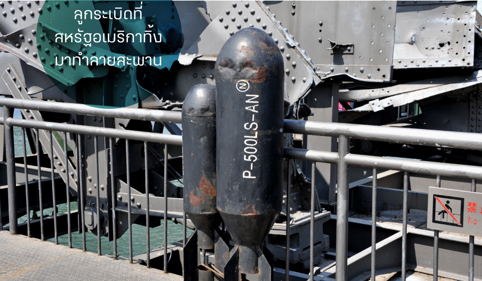
ลูกระเบิดที่ สหรัฐอเมริกาทิ้ง มากำลายสะพาน