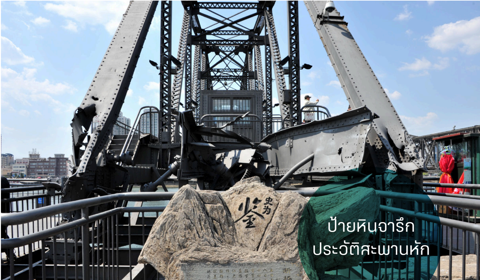
ป้ายหินจารึก ประวัติสะพานหัก