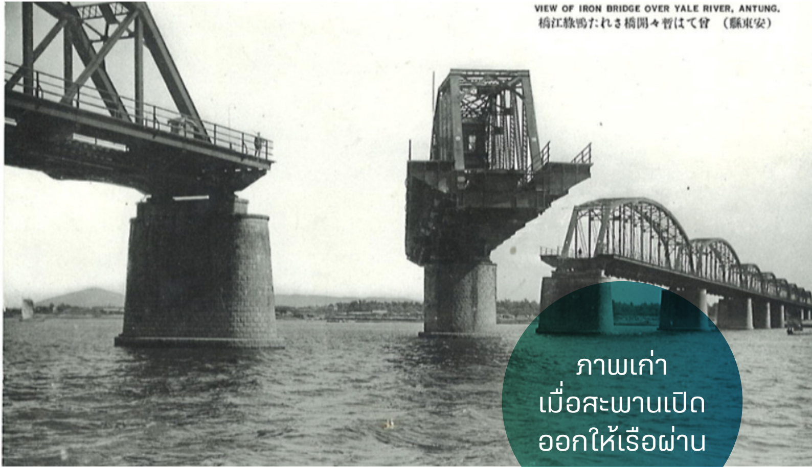
VIEW OF IRON BRIDGE OVER YALE RIVER, ANTUNG. 橋江鉄鴨たれさ橋開々暫はて曾 (縣東安)