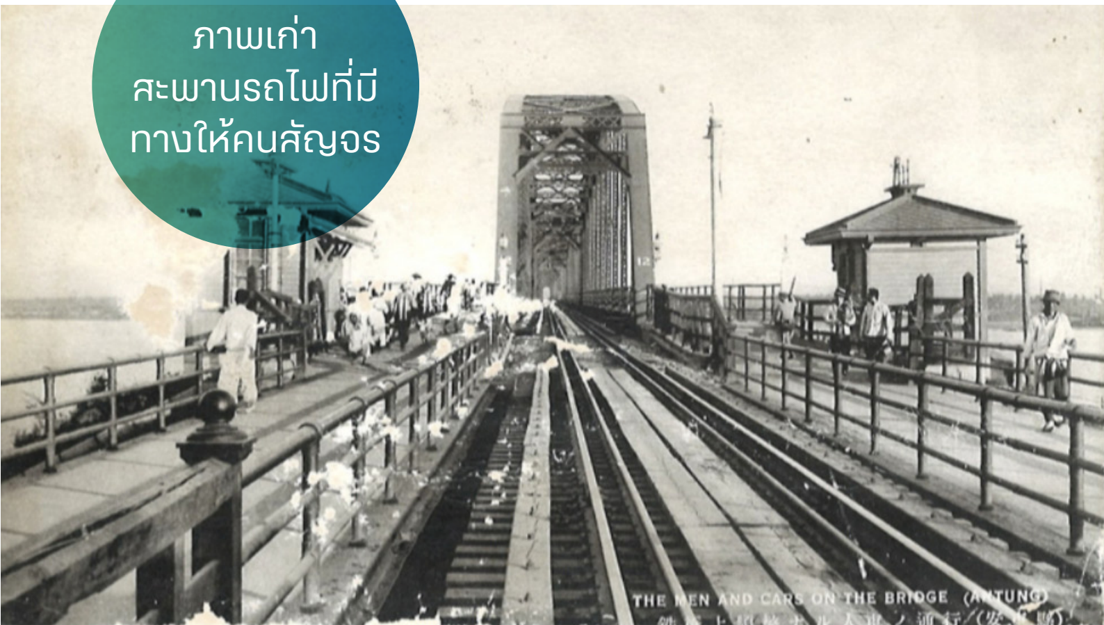
THE MEN AND CARS ON THE BRIDGE (ANTUNG) 鉄橋上車格士人車ノ通行 (安東縣)