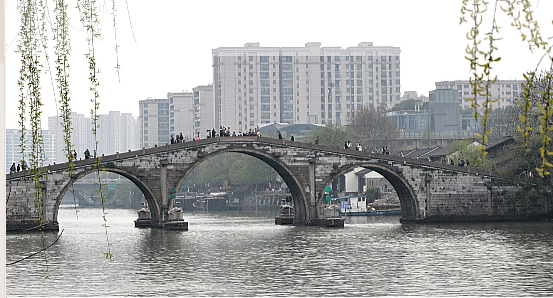
** สะพานงเฉิน สร้าง ค.ศ. 1631 สมัยราชวงศ์หมิง **

จุดท่องเที่ยวสำคัญแห่งหนึ่งในการชมคลองที่หังโจว คือ สะพานงเฉิน (งเฉินเฉียว) สะพานโค้งที่ก่อด้วยหิน มีซุ้มโค้งใต้สะพานสามซุ้ม สะพานนี้เริ่มแรกสร้างในสมัยจักรพรรดิฉงเจินแห่งราชวงศ์หมิง ใน ค.ศ. 1631 ต่อมาบูรณะในสมัยราชวงศ์ชิง สะพานยาว 92.1 เมตร สูง 16 เมตร กว้าง 5.9 เมตร บริเวณสองข้างสะพานเก่าแห่งนี้นอกจากจะมีสวนสาธารณะและทางเดินริมคลองแล้ว ยังมีพิพิธภัณฑ์ของทางการและของเอกชน ร้านค้าและร้านอาหารที่ผสมผสานทั้งแบบเก่าและใหม่ อย่างมีชีวิตชีวา